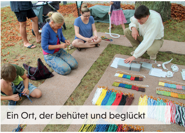
Ein Ort, der behütet und beglückt