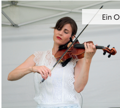
Ein Ort voller Liebe & Zuwendung